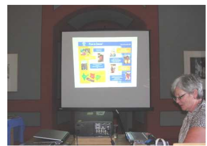
Paten fragen nach: aktuelle Zahlen* der Organisation Plan

Besonders erfreulich vor dem Hintergrund der guten Zusammenarbeit mit dem Museum ist es, dass die Ausstellung bis Ende September 2012 verlängert wurde.